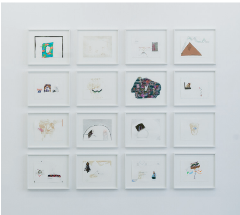
Nilbar Güreş, geb. 1977

Plattendirektdruck auf Acrylglas, beidseitig bedruckte Acrylglasplatten