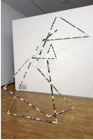
Eva Beierheimer, geb. 1979

DOSTOJEWSKI , 2016 Ausstellungsansicht Neue Galerie Graz, 2016, Holzstäbe und Text, ca. 400 x 350 x 250 cm