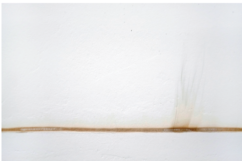
Judith Fegerl, geb. 1977

OHNE TITEL , 2016 Installation, Stahl, elastisches Band