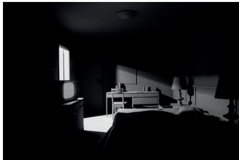
Bernd Oppl, geb. 1980

Videostills aus -5°C 40% rF , 2016, HD 16:9, Farbe, ohne Ton, 7:22 Min.