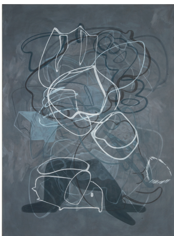
Ute Müller, geb. 1978

CAMOUFLAGE , 2016 von der Serie „Land of Black Milk“, Rio de Janeiro, 105 x 70cm, Pigment Print, Edition 10