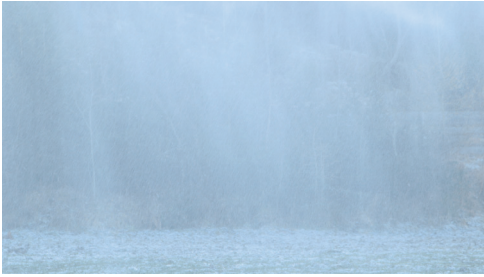
Simona Obholzer, geb. 1982

Videostills aus -5°C 40% rF , 2016, HD 16:9, Farbe, ohne Ton, 7:22 Min.