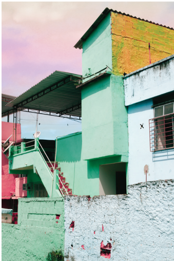
Stefanie Moshammer, geb. 1988

UNTITLED (FILMSETPERFORMANCEBÜHNEFILM) , 2009 Performance/Installation/Film Spiegel, 35mm-Kamera, Licht- und Soundequipment variable Dimensionen 35mm-Film, Farbe, Optischer Ton, 1:1,85, 4:20min Courtesy: Christoph Meier, Foto: Gregor Titze