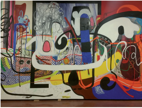
Christian Rosa, geb. 1984

UNTITLED , 2017 450x350 cm, Ölfarbe, Sprayfarbe, Ölstick, Kohle und Resin auf Leinwand © 2017 Christian Rosa Studio